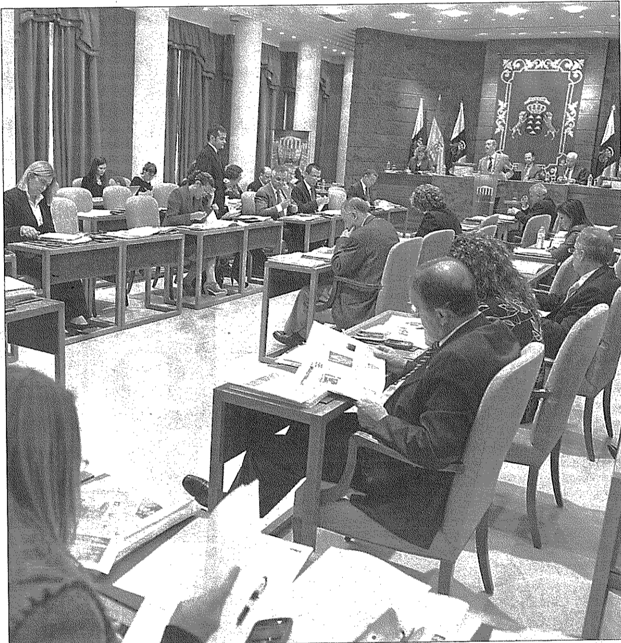
Pleno. Imagen de archivo de una sesión del Parlamento de Canarias.

La institución argumenta además que «la sociedad actual no sólo exige que el dinero público se utilice respetando la ley y que las cuentas de las administraciones reflejen adecuadamente la actividad económico-financiera llevada a cabo, sino que también reclama que la utilización de los fondos públicos esté basada en criterios de eficacia, eficiencia y economía», según se plasma en el escrito.